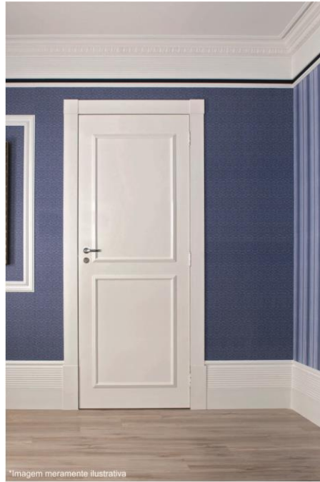
Arq. Josiane Flores